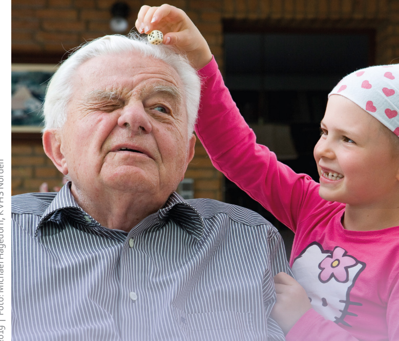
Stand: August 2019 | Foto: Michael Hagedorn, KVHS Norden